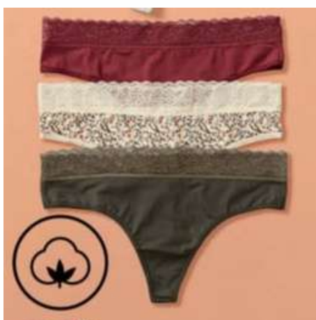
TANGAS 9,95€ Tallas S,M,L