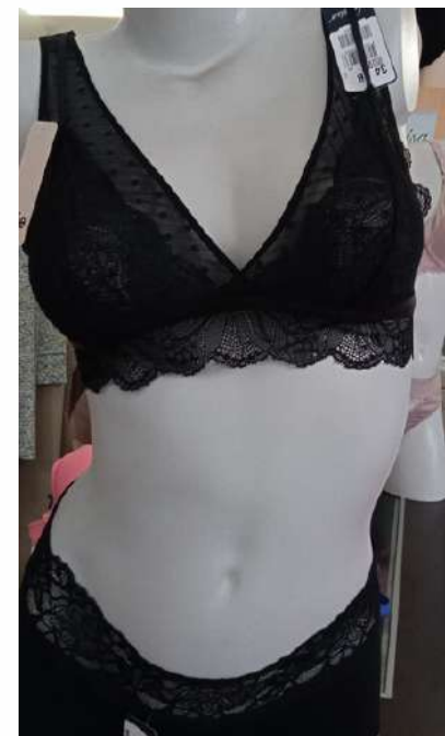
SUJETADOR 29,95€ Tallas 85,90,95 BRAGAS 14,95€ Talla S,M,L