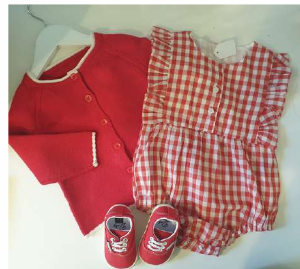
PELELE VICHY 20,00€

Con volantes en mangas, disponible en azul y blanco.