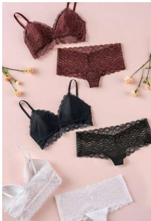
CONJUNTO 39,90€ tallas S,M,L,XL