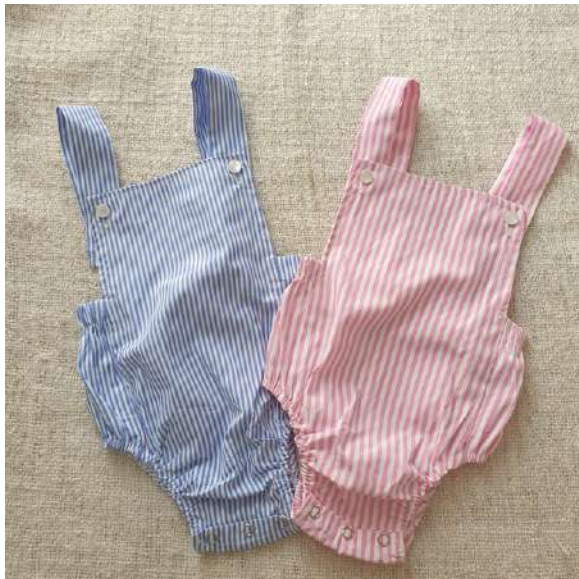
PETO MIL RAYAS 21,00€

LA TIA CHUCHES, Iparraguirre 15, GROS ☎ 657 534 607