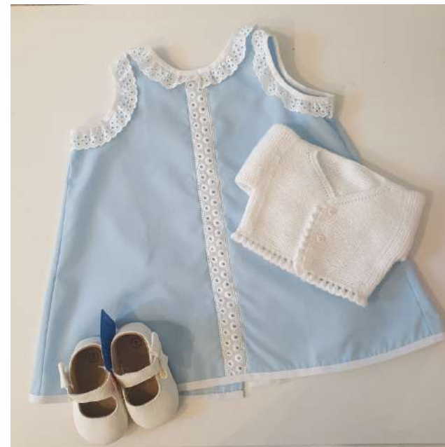
VESTIDO HECHO A MANO 35,00€