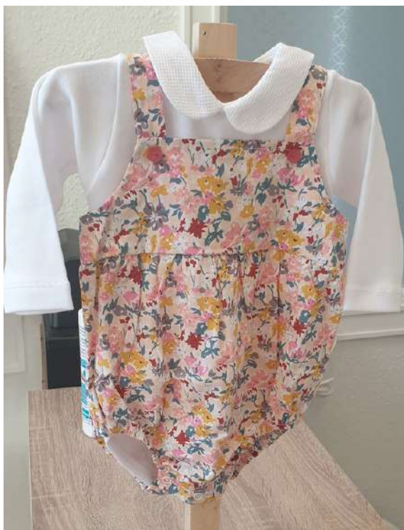
PELELE LIBERTY 21,00€

POLO/BODY manga larga y cuello pique, 15€