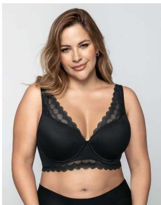
SUJETADOR 49,95€ Tallas 90,95,100 copa C Gran capacidad