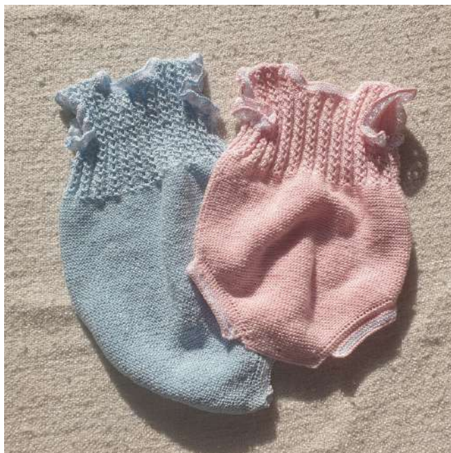
PELELE 100% COTTON 40,00€

POLO/BODY manga larga y cuello pique, 15€